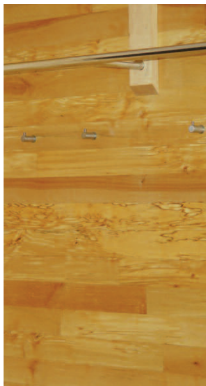
Panel, surnet bjørk.

Heksekoster er et vanlig syn på dunbjørk i hele landet. De består av mange korte tettsittende skudd som filtreres inn i hverandre, og danner en kuleformet utvekst. Bladene på heksekostgreinene er mindre enn normalt, gjerne litt buklete og blekere grønne. Heksekoster oppstår når treet angripes av parasittsoppen Taphrina betulina .