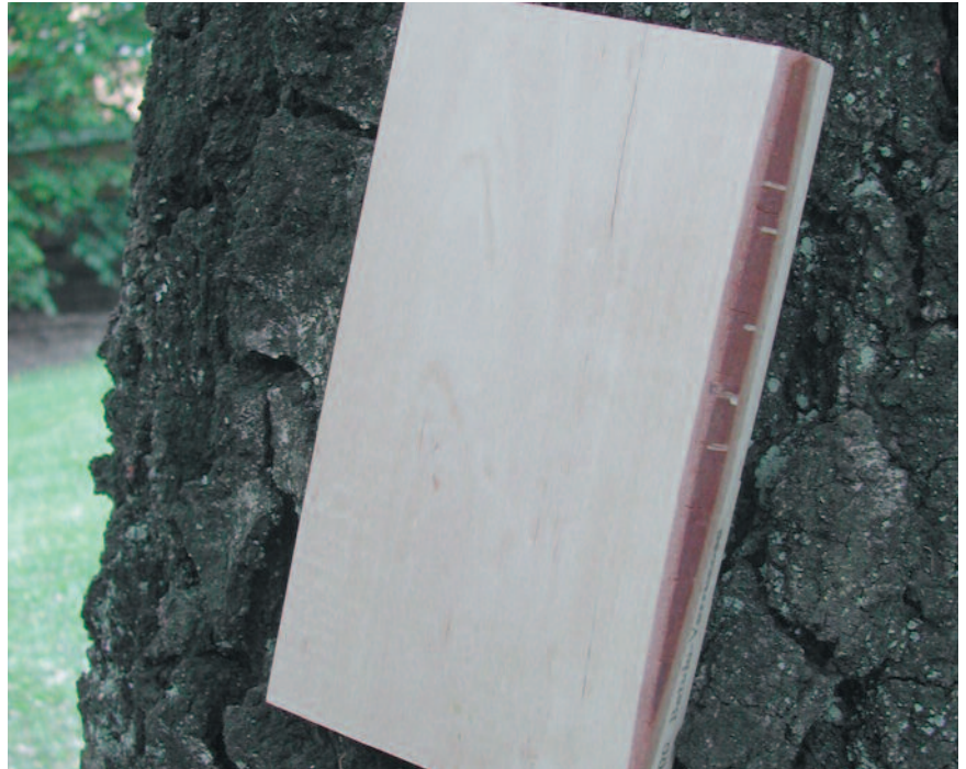
Bjørkeveden har en lys gulhvit elfenbensfarge.

Flammeved dannes når fibrene går i et jevnt bølget forløp. Dette gir veden et flammete utseende med vakker glans. Flammeved finner man hos hengebjørk i den nedre del av stammen på trær med grov oppsprukket skorpebark. Flammebjørk har ofte dårlig vekst og uregelmessig kvistsetting. Stammen blir flaske-