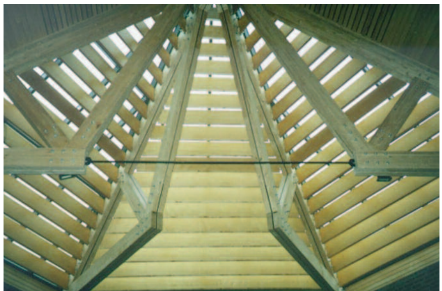
St. Laurentius kirke, Drammen.

melkeprodukter har lang holdbarhetstid i butter og koter laget av bjørkenever.