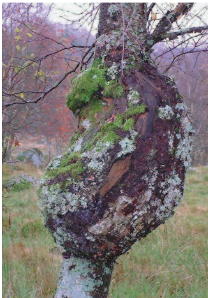
Kote på bjørk.

Fra tid til annen kan bjørketømmer inneholde kalved i større eller mindre deler av stammetverrsnittet. Kalved ser ut som råte, men er kun misfarget ved. Fargeforandringen skyldes bakterier og sopper (gjærsopper og farge-skadesopper). Det eksisterer bare et fåtall undersøkelser om egenskapene til kalved, men disse viser ingen eller liten forskjell i forhold til ufarget ved. Man antar derfor at styrkeegenskapene ikke er redusert.