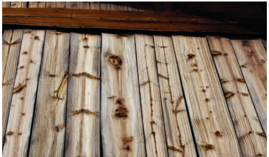
Furukledning brukt på stabbur med godt takutstikk.

Når yteved hos furu omdannes til kjerneved, blir porene i veden tett slik at kjerneveden blir lite gjennomtrengelig for vann. Kjerneved hos furu inneholder stoffer som beskytter kjerneveden mot nedbrytende organismer, som ulike sopper og insekter. En