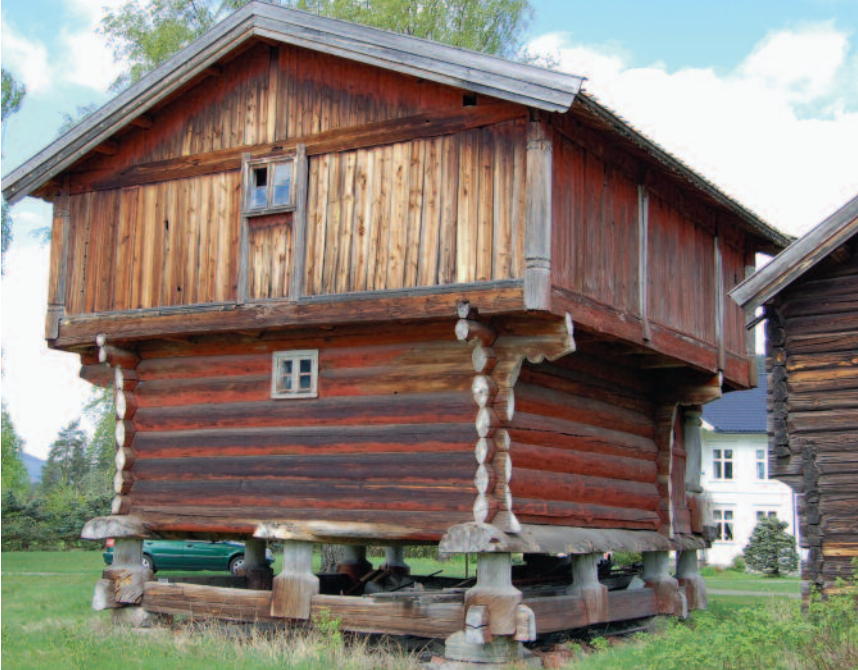
Vangestadloftet i Numedal. De opprinnelige furumaterialene er fra 1300-tallet. Bygningene er senere utvidet.

hatt? Hvordan er håndverket utført? Hvilken sammenheng er det mellom materialkvalitet, teknisk og estetisk utforming?