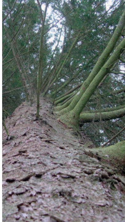
Her har grantrærne stått for tett. På en side har stammen rensset seg for kvist, og den danner tørr kvist inne i stammen. Den andre siden av treet vokser grov frisk kvist. Dette gir også en oval stammeform.