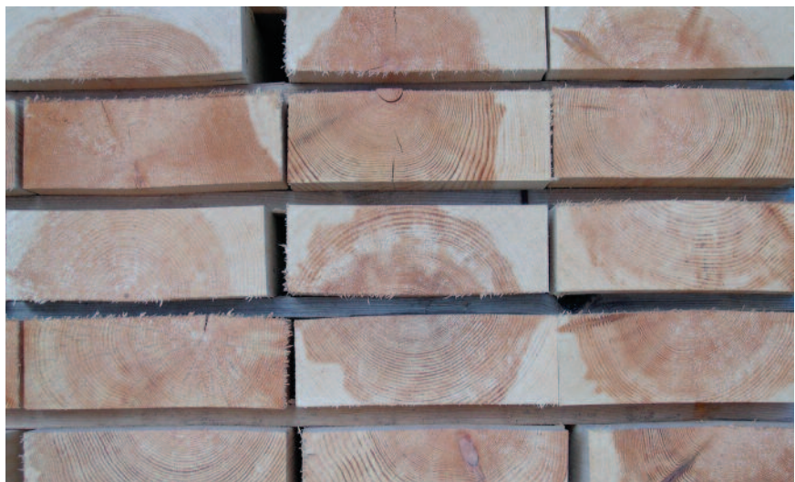
Trelast med betydelig andel kjerneved.

undersøke modenheten tar utgangspunkt i kjerneveddannelsen. På høsten før frosten setter inn, kan man hugge et sår i barken i skulderhøyde. Hvis såret om våren ikke har fylt seg med kva, er treet fullmodent, men hvis det derimot har dannet seg en kvaeskorpe på såret er treet umodent.