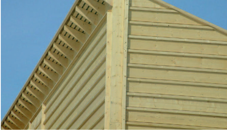
Nyoppført liggende lektepanel.

det gjelder å begrense fukt-opp-taket i kledningsprøver. Dette er en viktig faktor for å redusere råte i ubehandlet, utvendig kledning. For å kunne utnytte den egenskapen, må kledning ha mulighet til å tørke opp etter nedbørsperioder. Det er derfor viktig at arkitektonisk utforming og konstruksjons-messige detaljer baseres på at nedbør skal ledes effektivt bort fra trevirket.