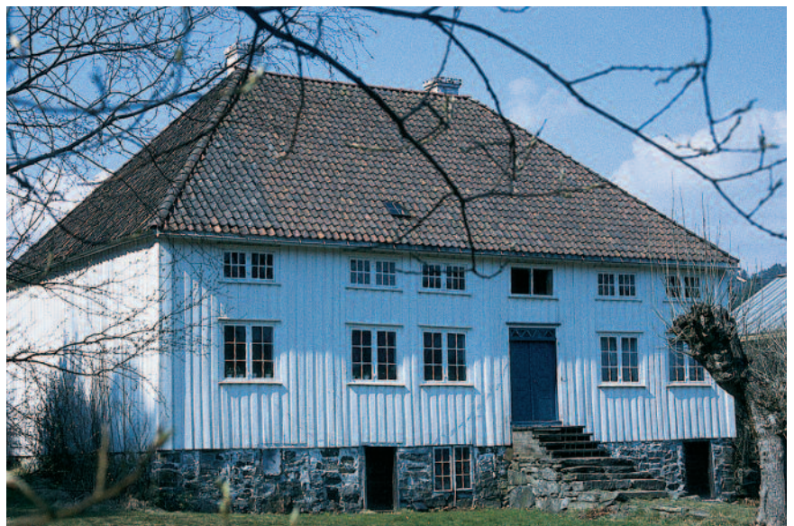
Bossvika i Risør er oppført ca. 1750 og har fortsatt det meste av den originale ytterkledningen intakt.

Bjørk har en sentral plass i skogen i Nord-Norge. Man kan finne noe bjørk brukt i eldre bygninger. Bjørk har relativt liten varighet ved utendørs bruk.