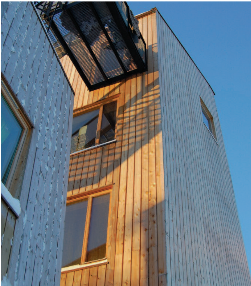
Svartlamoen, kledning i furu kjerneved.

utstrekning. Denne ble i første rekke valgt ut fra vedlikeholdsmessige hensyn. Materialvalget var basert på tradisjonsbasert kunnskap og ble i stor grad innarbeidet i kravspesifikasjonene.