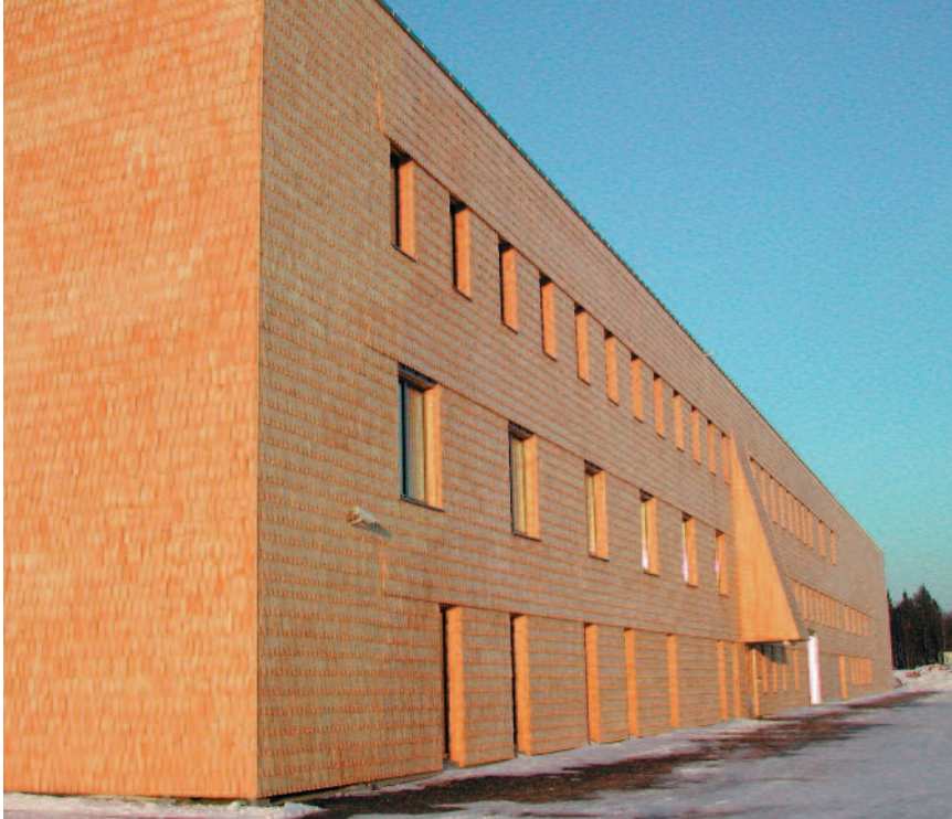
Kjerneved furu brukt som sponkledning. Rena Leir under oppføring.