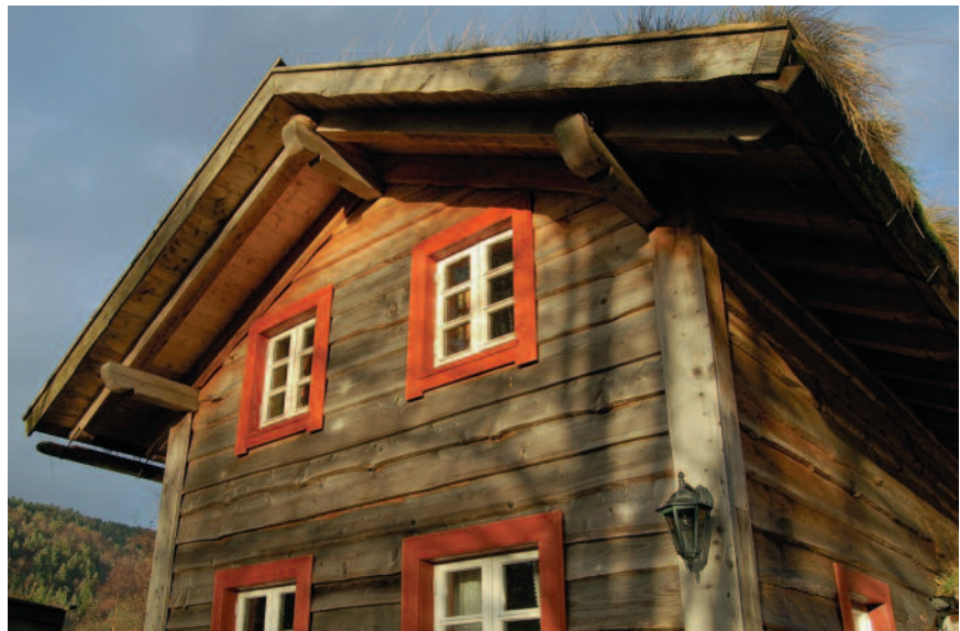
Gode takutstikk gir lang levetid .

seg på lange tradisjoner med forankring i egne forfedres kunnskaper, og er erfaringskunnskap i større grad enn teoretisk kunnskap.