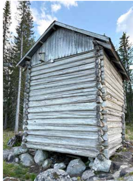
Laft, the well-known log building technique constructed by interlocking horizontally placed logs at the corners.

There is an increasing interest in building with wood. As such NTI has a great position and potential to contribute to improvement in production of wood products, and