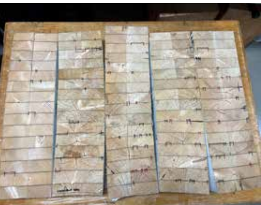
Limtreprøver etter tørking. Åpninger i limfuger er merket med tusj og er klar til avlesning.