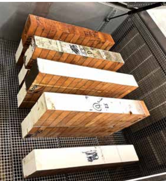
Limtreprøvene under tørking etter impregnering med vann.

I etterkant av forskningsprosjektene sirkTRE og circWOOD fortsetter Treteknisk arbeidet med gjenbruk av trebaserte byggeprodukter. Bildene viser prøver tatt fra limtrebjelker fra en demontert idrettshall. Treteknisk tester prøvenes motstand mot delaminering for å vurdere limtrebjelkenes egnethet for ombruk.